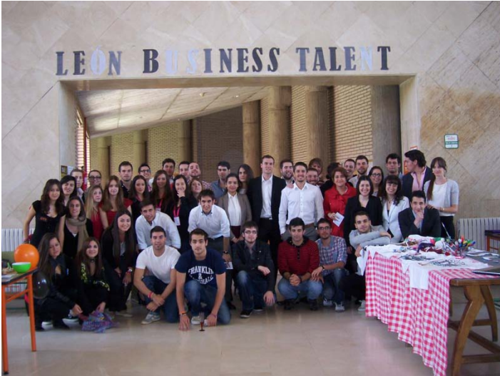
Foto de los profesores y equipos participantes.

El pasado martes 28 de mayo de 2013 tuvo lugar en la Facultad de Económicas de la Universidad de León la primera edición del "León Business Talent". Esta edición contaba con una veintena de stands, en la que los distintos equipos formados por alumnos de los grados de Marketing y Administración y Dirección de Empresas presentaban sus ideas o modelos de negocio en busca de "Business Angels".